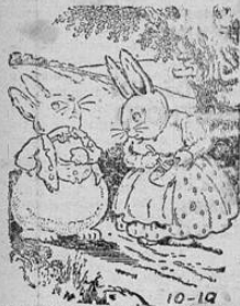
CUENTOS PARA NIÑOS